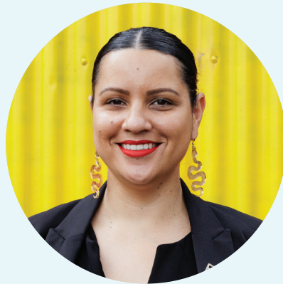
Senator Jana Stewart 参议员 亚娜·斯图尔特

历经岁月洗礼的澳洲长者们是我们社区的中流砥柱，他们理应享有有尊严的，舒适的退休生活。